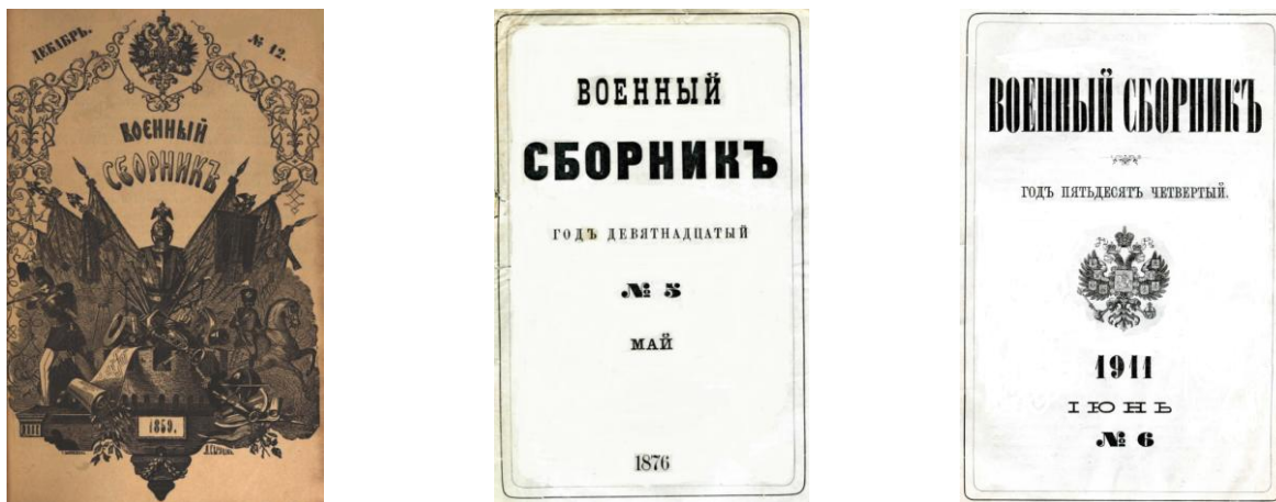
Рис. 1. Титульные листы журнала «Военный сборник» в дореволюционный период